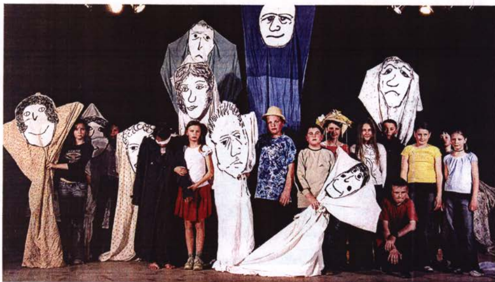
NATURALNY TEATR WIEJSKI z Lubeni